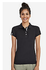
SOL'S PORTLAND WOMEN 00575